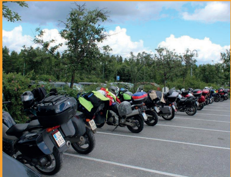
Taukopaikalla pyöriä mahtava rivistö. Kuva vuoden 2015 retkeltä, jolloin matka suuntautui Viroon.

Tarkempi matkaohjelma matkareitistä, klo ajoista ja tapahtumista ilmoitetaan osallistujille lähempänä ajankohtaa. Voit osallistua retkelle myös osan matkaa, jolloin hinta on edullisempi. Kerro osallistumispäivät ilmoittautumisvaiheessa.